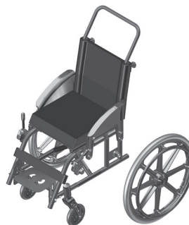
Figura 1.3- Retirada da roda traseira