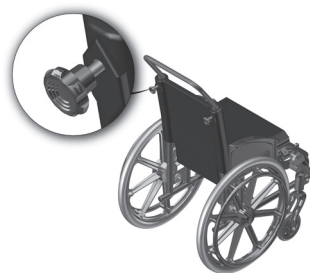
Figura 3.1- Indicação dos manípulos de fixação do prolongador de encosto.

O prolongador de encosto pode ser regulado na altura e também pode ser retirado da cadeira para esta operação basta abrir os dois manípulos localizados na parte traseira da cadeira conforme indicado na figura 3.1.