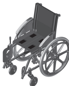
Figura 5.1- Cadeira pronta para ser dobrada

Para desdobrar exerça pressão sobre as laterais do assento até a cadeira abrir.