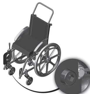
Figura 4.1- Indicação do parafuso de sustentação do pedal

É recomendado manter um mínimo de 50 mm entre o ponto mais baixo do pedal e o chão, isto proverá liberação adequada para superfícies desiguais e prevenirá danos ao mesmo.