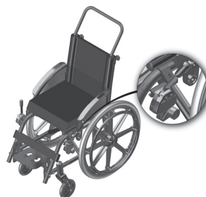
Figura 2.1-Indicação da posição do freio quando não acionado