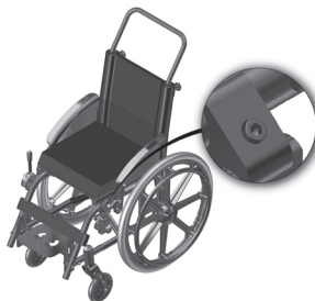
Figura 2.2 Indicação do parafuso de regulagem do freio.

Para alterar a posição do conjunto de freio abra o parafuso (indicado na imagem 2.2) um de cada lado, para avançar ou recuar a posição do freio. Use uma chave Allen número 5 para abrir (gire no sentido anti-horário). Feita a regulagem torne a apertar. Durante esse procedimento, a pintura da cadeira de rodas pode vir a ser danificada, realize-o com cuidado.