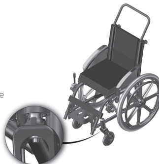
Figura 1.5 – Extração do conjunto dianteiro

a. Erga a cadeira de rodas e pressione o botão do eixo de extração rápida, localizado abaixo do garfo;