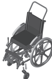
Figura 1.6- Retirada da roda dianteira

b. Puxe a roda, de forma a desencaixá-la, mantendo o botão pressionado;