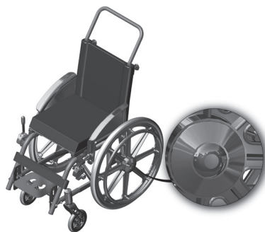
Figura 1.2- Indicação do botão de extração do eixo traseiro